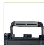
Ручка с мягким покрытием