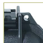
Отверстие для навесного замка