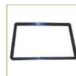
Держатель приборной панели в корпусе