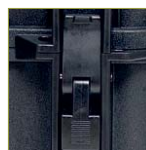
Надежный запирающий механизм