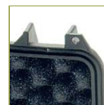
Уплотнительное кольцо в крышку