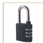
Навесной кодовый замок