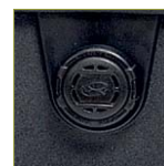
Автоматический клапан выравнивания давления