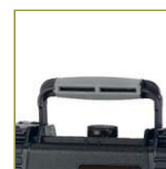
Ручка с мягким покрытием