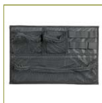
Организер в крышку