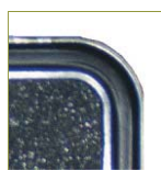
Уплотнительное кольцо в крышку