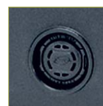
Автоматический клапан выравнивания давления