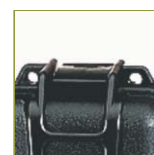
Отверстие для навесного замка