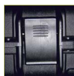
Надежный запирающий механизм