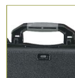
Ручка с мягким покрытием