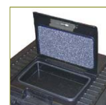
Наружный брызгозащищенный отсек для документов и мелких предметов