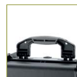
Ручка с мягким покрытием