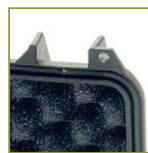
Уплотнительное кольцо в крышку