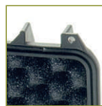
Уплотнительное кольцо в крышку