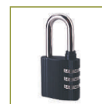
Навесной кодовый замок