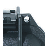
Отверстие для навесного замка