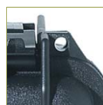
Отверстие для навесного замка