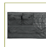
Органайзер в крышку