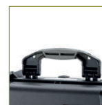
2 ручки с мягким покрытием