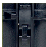
Надежный запирающий механизм