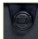
Автоматический клапан выравнивания давления