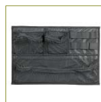
Органайзер в крышку