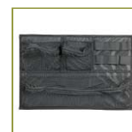
Органайзер в крышку