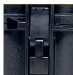
Надежный запирающий механизм