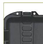
Отверстие для навесного замка