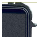
Уплотнительное кольцо в крышку