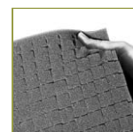
Пенополимер с насечками