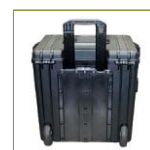
Телескопическая ручка и краевые ролики