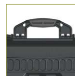
3 ручки с мягким покрытием